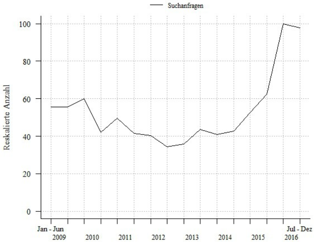
Suchanfragen für »Virtuelle Realität«