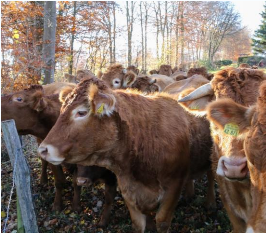
Verordnung zur Änderung der 1. Fleischgesetz- Durchführungs- verordnung