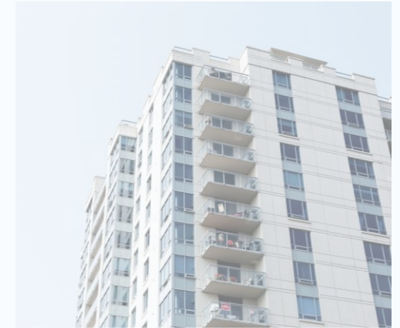
Gesetz zur Zulassung virtueller Wohnungseigentümer- versammlungen