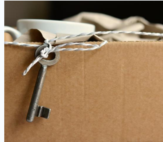
Zweites Gesetz zur Änderung des Bundesmeldegesetzes